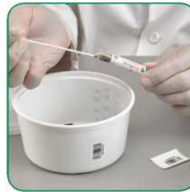
နမူနာထိပ်ဖျားကို FecalSwab™ ပြန်ထည့်ပြောင်းထည့်ပြီး လေ ဘယ်ပေါ်ရှိ အများဆုံး ဖြည့်မှတ် မျဉ်း (“MAX. FILL”) ထက် မကျော်လွန်ကြောင်း စစ်ဆေးပါ။ မှတ်ချက်။ ရယူထားသော ဝမ်းနမူနာ သည် အများဆုံးဖြည့်မှတ်မျဉ်း ထက် ကျော်လွန် ပါက နမူနာတံနှင့် ပြန်ကို စွန့်ပစ်ပြီး အခြား FecalSwab™ ကို အသုံးပြု၍ နမူနာ အသစ်တစ်ခုကို ရယူစုဆောင်းပါ။