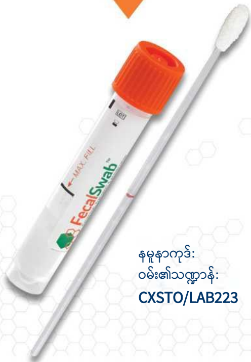
နမူနာကုဒ်: ဝမ်း၏သဏ္ဍာန်: CXSTO/LAB223