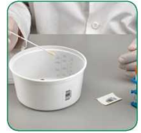
နမူနာ၏ထိပ်ပိုင်းစပိုင်းအားလုံးအား ဝမ်းနမူနာထဲသို့ ထည့်၍ လှည့်ပြီး ဝမ်းနမူနာအနည်းငယ်ယူပါ။ မှတ်ချက်။ သွေးရှိသော၊ ချွဲနေသော၊ အရည်များသော နေရာများကိုယူသင့်ပါသည်။