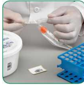
ကပ်အိတ်ကိုဖွင့်ပါ

Parkview Health သည် လက်ရှိ ဝမ်းနမူနာစုဆောင်းနည်းစနစ်များကို COPAN FecalSwab™ ဖြင့် အစားထိုးမည်ဖြစ်ပါသည်။