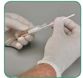
လက်မနှင့် လက်ညှိုးကြားရှိ နမူနာကိုင်တံကို ကိုင်ထားပြီး မျှတစွာပျံ့နှံ့စေရန်နှင့် နမူနာပြန် တွင်စနစ်တကျရှိစေရန် နမူနာပြန်နံရံထဲ၌ ဝမ်းနမူနာကို ရောမွှေပါ။