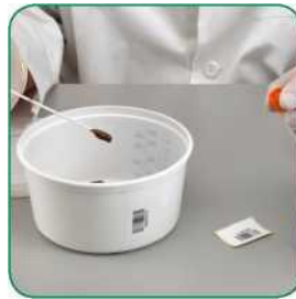
နမူနာတံ၏ထိပ်ဖျားတွင်ဝမ်းများ မြင်နိုင်စေရန် သေချာစစ်ဆေးပါ။ လိုအပ်ပါက နမူနာထိပ်အား မစင် နမူနာထဲသို့ ထပ်မံထည့် သွင်းပြီး နမူနာထိပ်ဖျား၏ ဧရိယာအားလုံး ကို ဝမ်းနမူနာနှင့် ထိတွေ့ရရှိ ကြောင်း သေချာစေရန် လှည့်ပါ။