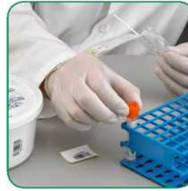
နမူနာကိုထုတ်ယူပါ။ နမူနာတံ ထိပ်ဖျားကို မထိပါနှင့်။ ပိုင်းခြားအမှတ် အပေါ်မှ နမူနာလက်ကိုင်နေရာ ကိုသာ အမြဲကိုင်ပါ။