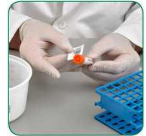
ပြန်ပေါ်တွင် လူနာ၏အမည်နှင့် သက်ဆိုင်ရာ အချက်အလက်များ ကိုရေးပါ သို့မဟုတ် လေဘယ် တစ်ခု အသုံးပြုကာ နမူနာအား ဓာတ်ခွဲခန်းသို့ ပေးပို့ပါ။