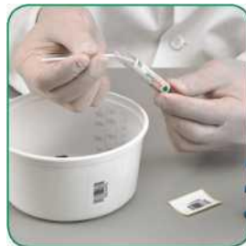
ပြန်ကို သင့်မျက်နှာနှင့် အဝေးတွင် ထားပါ။ နမူနာတံ၏အဆုံးကို ကိုင်ထားပါ။ ပိုင်းခြားအမှတ်တွင်ကွဲ ပြားစေရန် ၁၈၀ ဒီဂရီကွေးပါ။ လိုအပ်ပါက ပြန်ထည့်လုံးဝကျန်နေရန် လက်မနှင့် လက်ညှိုးကြားရှိ နမူနာတံကို ညင်သာစွာလှည့်ပါ။ နမူနာတံအားဖယ်ရှားစွန့်ပစ်ပြီး နောက် အပိတ်ကိုတင်းကျပ်စွာ ပိတ်ပါ။