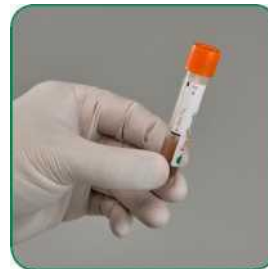
ဝမ်းနမူနာများ တစ်သား တည်းဖြစ်သည်အထိ ပုလင်းကိုလှုပ်ခါပါ။